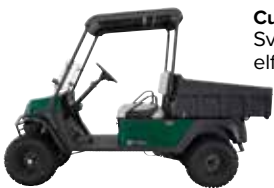
Cushman Hauler: Sveriges modernaste elfordon i alla storlekar.