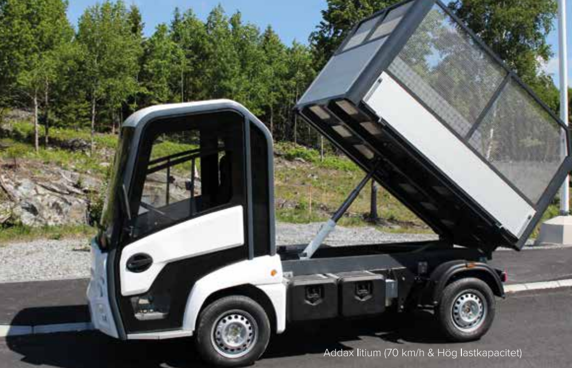
Addax litium (70 km/h & Hög lastkapacitet)