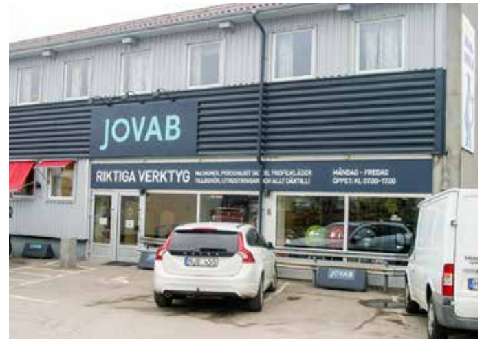
Skene Järn AB expanderar genom att förvärva JOVAB i Varberg.

del med en stark position inom personligt skydd, mot främst proffskunder inom bygg- och industriktorn med starka rötter i Varberg och Halland. Företaget omsätter idag cirka 28 mkr med totalt 9 anställda.