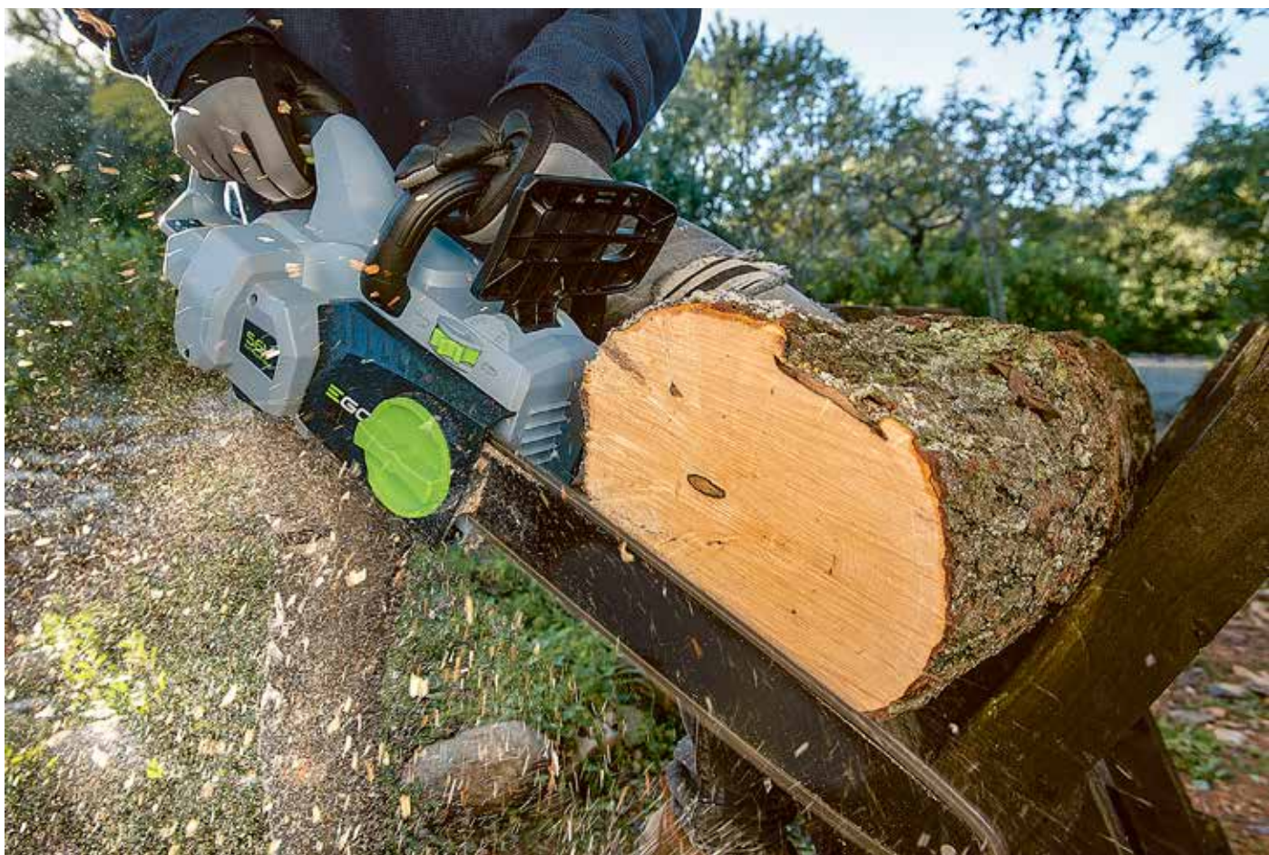
Den högre batterikapaciteten ger motorsågen från EGO en råstyrka som är fullt jämförbar med bensindrivna motsvarigheter, men utan avgaser, bränslehantering, hög bullernivå och hälsovådliga vibrationer. Och till betydligt lägre driftskostnad.

Bakom sig har EGO en av världens största tillverkare av eldrivna maskiner, med mer