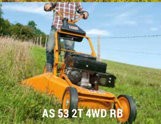
AS 53 2T 4WD RB

Maskiner för sly, slåtter och ogräs- bekämpning