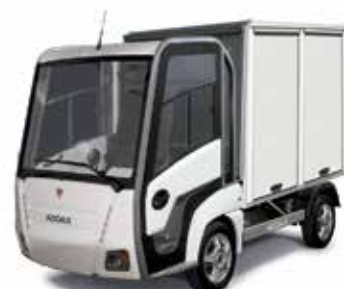
Addax litium med skåp (70 km/h & Hög lastkapacitet)