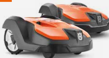
Husqvarna Automower® 520/ 550