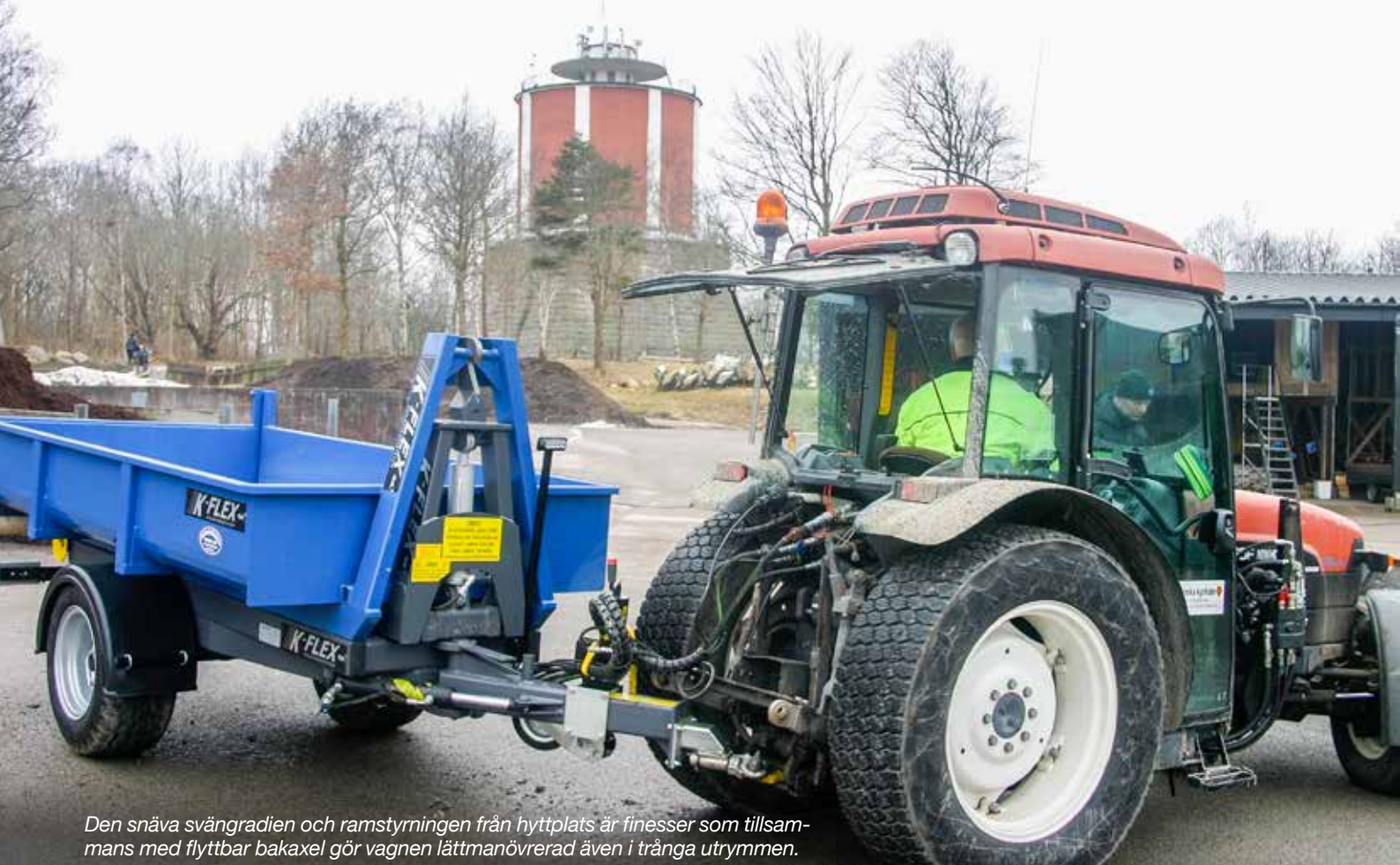
Den snäva svängraden och ramstyrningen från hyttplats är finesser som tillsammans med flyttbar bakaxel gör vagnen lättmanövrerad även i trånga utrymmen.