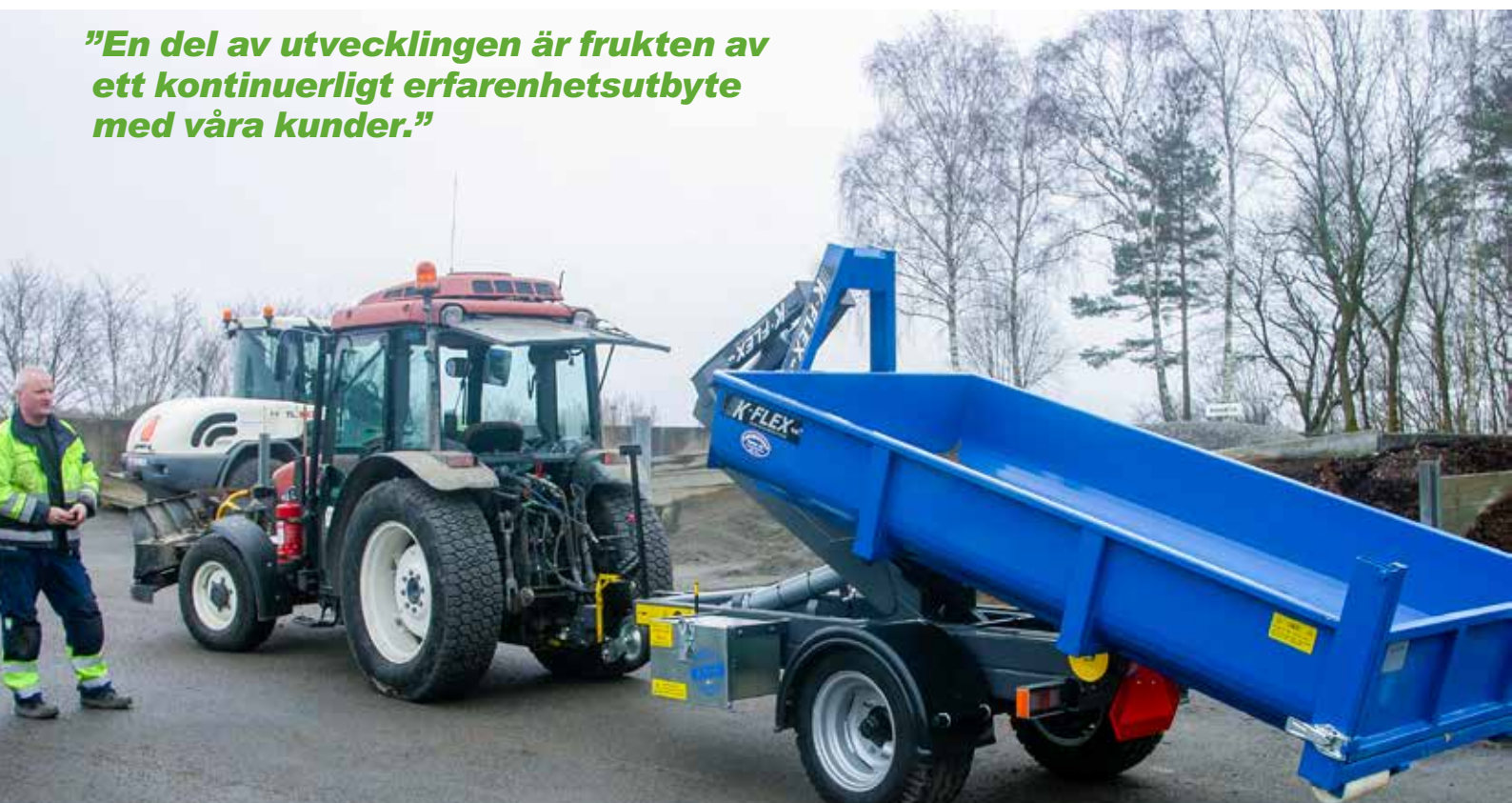
Den trådlösa fjärrstyrningen av lastväxlarssystemet är en finess som ger både säkerhet och överblick, inte minst vid tillkoppling av tillkoppling av lastväxlarflak på chassit, säger Håkan Johansson.

”En del av utvecklingen är frukten av ett kontinuerligt erfarenhetsutbyte med våra kunder.”