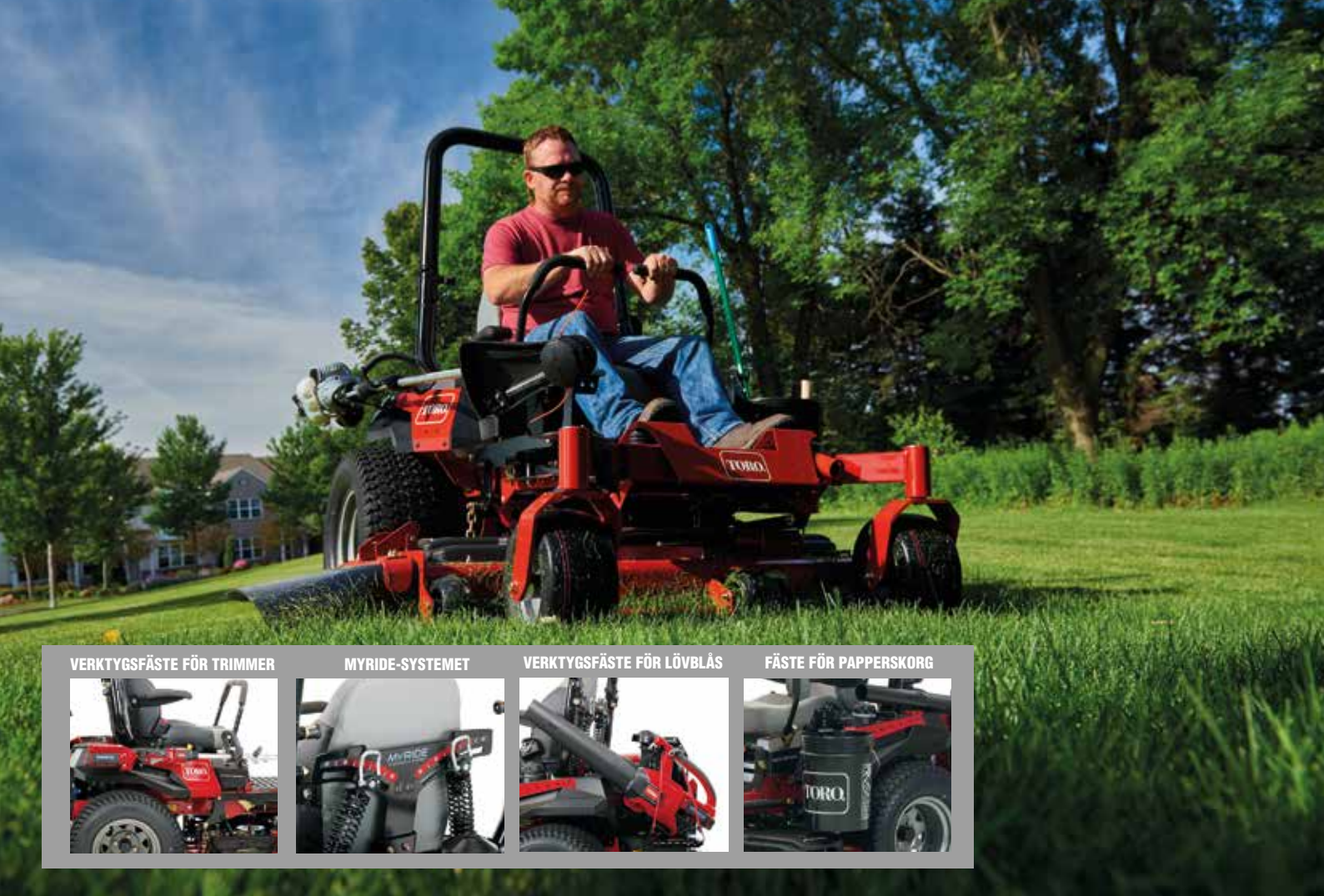
VERKTYGSFÄSTE FÖR TRIMMER