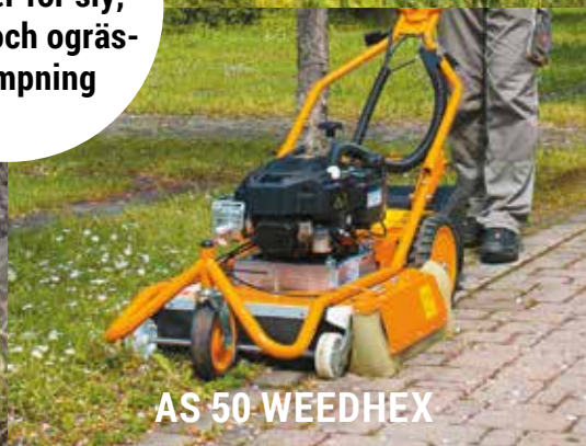
AS 50 WEEDHEX