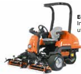
Eclipse 322 Lithium: Inget motorljud, inga utsläpp, bäst klipp.