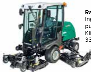
Ransomes MP653: Inga remmar, minst servicepunkter, effektivast klippning. Klippbredder mellan: 150, 180, 330, 350, 430 och 490 cm.