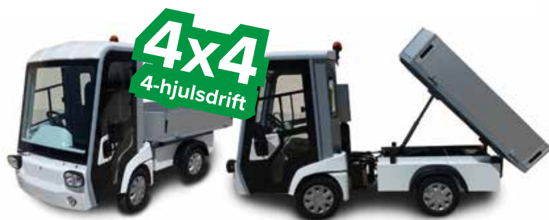
ART 4x4 Litium (Midjestyrd & 4-hjulsdrift med hög dragkapacitet)

Med litiumbatteri och en stark underhållsfri AC-motor får ni ett riktigt kraftpaket. Litiumbatterier har drygt 60% lägre vikt och 4 gånger längre livslängd än blybatterier. Vilket inte bara kommer att ge er ett av marknadens mest driftsäkra batterier, utan dessutom en lägre total milkostnad.