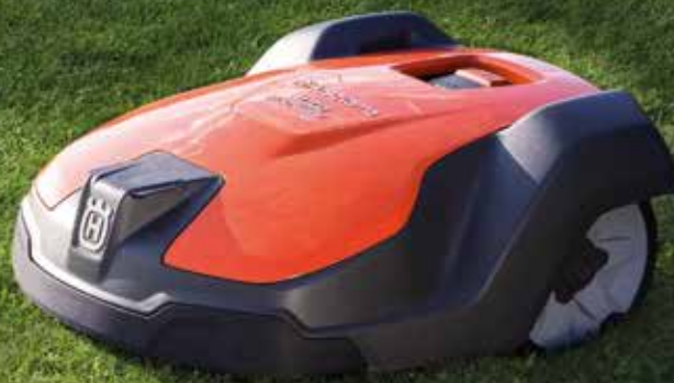
Husqvarna Automower® 520/ 550

VÄRLDS- LEDANDE INOM ROBOTGRÄS- KLIPPNING