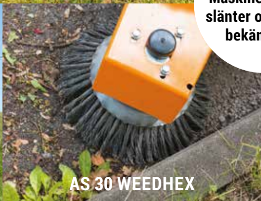
AS 30 WEEDHEX