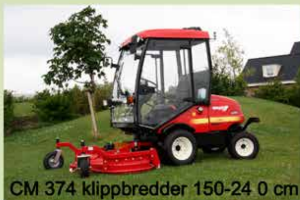
CM 374 klippbredder 150-240 cm