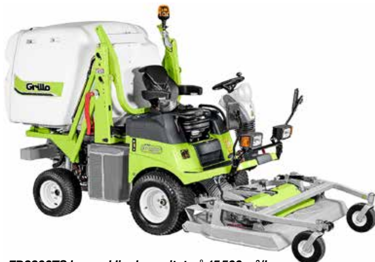
FD2200TS har en klippkapacitet på 15 500 m 2 /h och en uppsamlare på 1 400 liter.

ta och stripa på samma gång. Då klipparen även kan utrustas för vinteranvändning med bland annat plogblad, blir det en uppskattad året-runt-maskin.