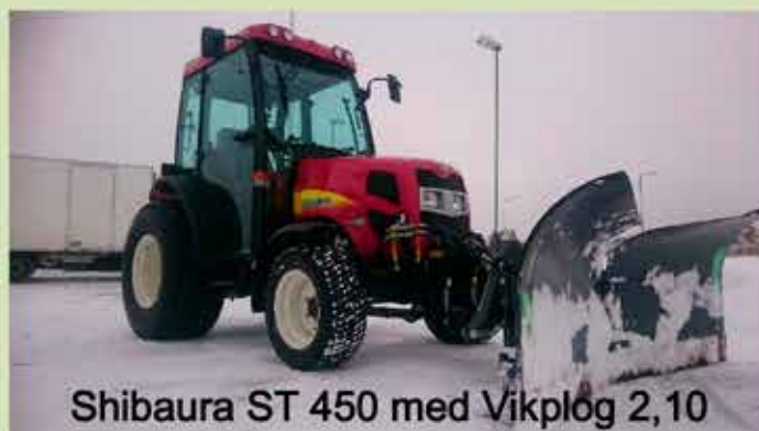
Shibaura ST 450 med Vikplog 2,10