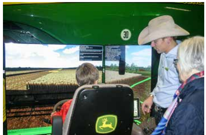
I en simulator fick gammal som ung testa hur det är att köra John Deeres stora jordbruksmaskiner.