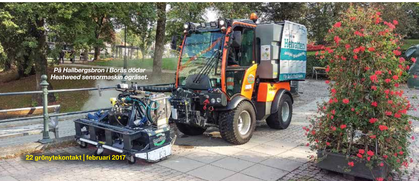
På Hallbergsbron i Borås dödar Heatweed sensormaskin ogräset.