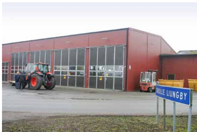
Verkstadslokalerna är inrymda i vad som en gång var godsets egen smedja. Efter tillbyggnader och moderniseringar inryms 800 kvadratmeter toppmodern verkstadsyta, med kontor, butik, lager och personalutrymmen.