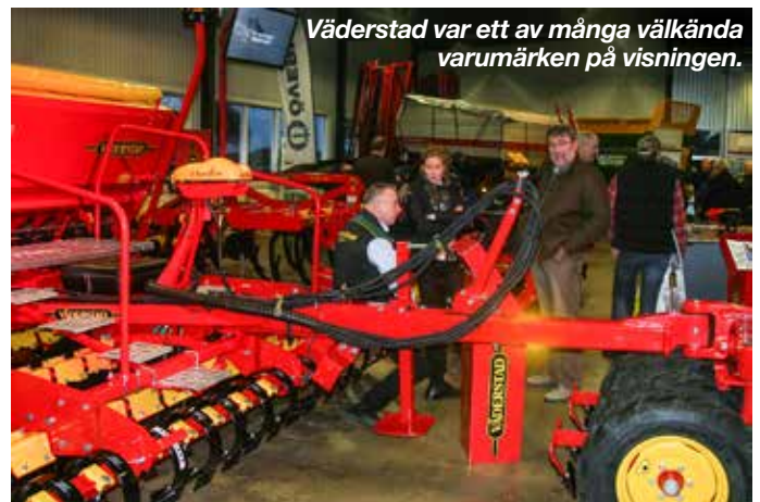
Väderstad var ett av många välkända varumärken på visningen.