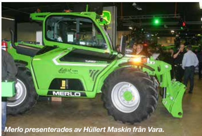
Merlo presenterades av Hüllert Maskin från Vara.