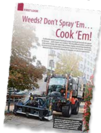
Storbritanniens största grönytetidning, MVO.

– Ja, detta är en dyr maskin. Därför är det viktigt att få gedi-