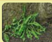
Efter 0,1 sek