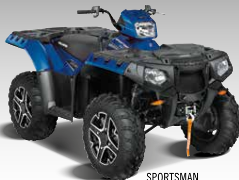
SPORTSMAN 850 SP FOREST