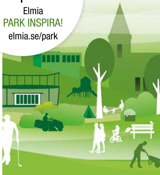
ILLUSTRATION: ANNEFRID SÖJMAN