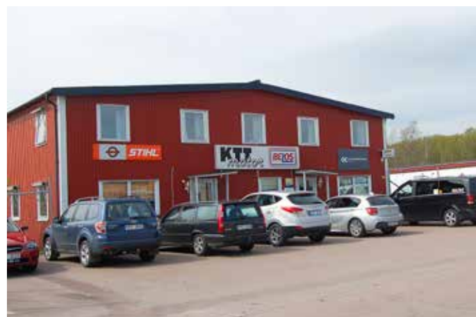
KTT Motors kundkrets är bland annat kommuner, bostadsbolag, kyrkor, entreprenörer och förvaltning.