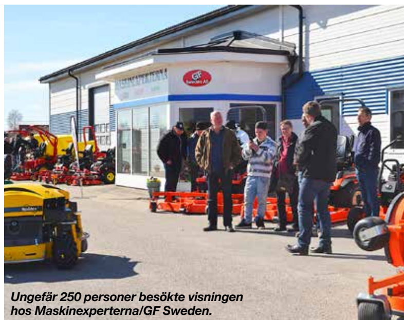
Ungefär 250 personer besökte visningen hos Maskinexperterna/GF Sweden.