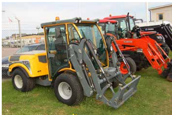
Kärcher-Belos och Kubota är några av alla varumärken som finns i sortimentet.