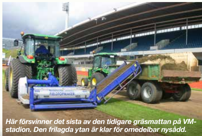
Här försvinner det sista av den tidigare gräsmattan på VM-stadion. Den frilagda ytan är klar för omedelbar nysådd.