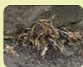
Efter 2-3 dagar